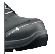
Coque de protection HAIX® en nanocarbonate