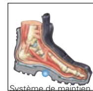
Système de maintien de la voûte plantaire HAIX® AS