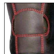
Système de protection du talon HAIX® FP System