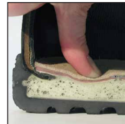
Système de mousse injectée HAIX® MSL