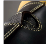
HAIX® FP Système pour la protection du talon d' Achille