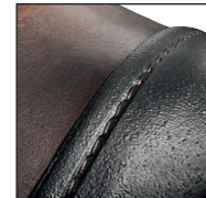
Protection de l'embout de sécurité avec encoche pour coutures