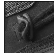
HAIX® 2-Zone Lacing