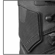
HAIX® Ankle Protector